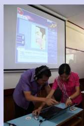
志愿者为府尹展示多媒体教材

另一边，30个学生正坐在电脑前使用中国高等教育出版社和泰国教育部联合开发的《体验汉语》系统学习汉语，他们认真地模仿和纠正发音，把电脑当成自己的中国朋友练习对话。