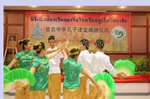
中文系学生献上的舞蹈表演

普吉中学成立于1897年，是泰国南部最有名的中学之一。该中学八年前开始开设汉语课程，其后一直致力于汉语教学的推广和传播工作。普吉中学孔子课堂是中国国家汉办和泰国教育部基础教育委员会合作建立的5所孔子课堂之一。