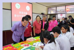
府尹和庞利女士参观课堂中文活动室