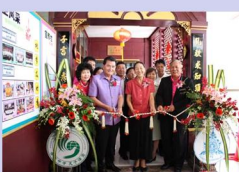
嘉宾们为孔子课堂剪彩

进行剪彩，并参观了课堂。无所不在的中国结提醒人们即将走进的是一个汉语世界：学生们操着汉语当上了小导游，介绍孔子课堂的情况。屏风中贴着学生的国画作品，墙上挂着沙燕风筝和中国刺绣，介绍中国语言和文化的书籍琳琅满目，来自中国各地的民间工艺品纷纷讲述着各自的历史。在汉语活动室