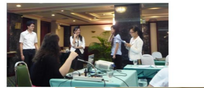
志愿者们正在交流教学经验

普吉中学孔子课堂的负责人表示, 以后这样有利于汉语教学的师资培训活动将继续开展下去, 为在泰汉语教师提供更多更好的交流平台, 今后会不断努力为推动汉语教师教学水平做出贡献。