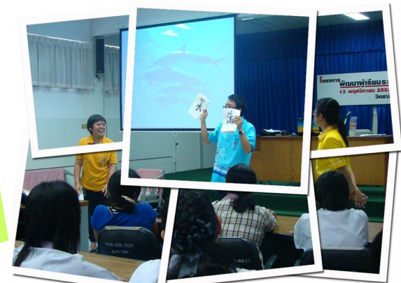
介绍汉字的演变轨迹