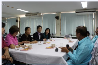
与当地校长座谈, 调研志愿者情况

(普吉中学孔子课堂 陈振) 2月3日-5日, 国家汉办泰国代表处在庞利老师的带领下连同泰国教育部基础委、民校委、职教委、高教委等单位项目官员远赴泰国南部甲米、素叻等地学校调研访问并看望志愿者。