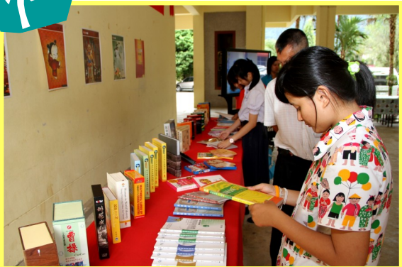
前来参赛的学生,在紧张的比赛结束后都流连在展台前,不愿离去