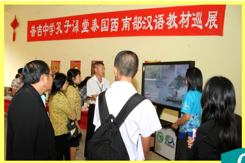
大家都对中国文化体验仪器产生了浓厚的兴趣

“孩子们认真地编结,在红绳翻飞中听老师讲述中国结的吉祥含义。一根根亲手编就的红绳套上手腕,就像孩子们渴望知识的眼睛一样新鲜明亮”